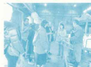
総合的な廃棄物管理 Cコース