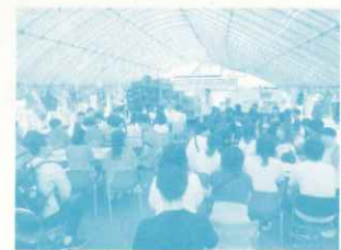
ハウス食品グループ本社（株） 内定者研修