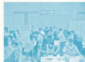
ゆめ・まちフェスティバル