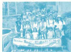
ハウス「食と農と環境の体験教室」in西宮

保育士・教員対象の環境教育研修、幼児対象子育てイベント、甲山農業塾、コープこうべ「農とくらしをつなぐサポーター養成講座」では、森・里山・くらしをつなげるプログラムとして社家郷山での森林整備や野外調理を行いました。