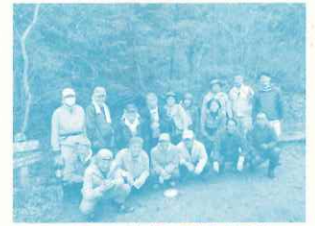
にしのみや都市型里山里地 ボランティア活動