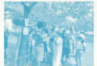
樹木につけられたクイズを説明するPTAの保護者