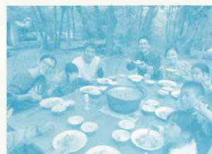
伊藤ハム「食とeco」わくわく探検隊