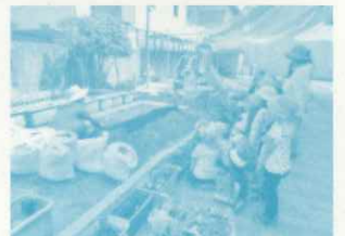
保育所：苗の植え付けを学ぶ子どもたち