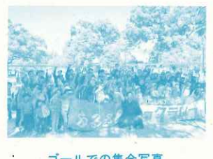
ゴールでの集合写真