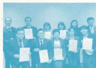
くるびこキャンペーン寄付金授与式