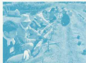
農とくらしをつなぐサポーター養成講座