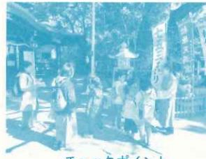
チェックポイント 松原神社