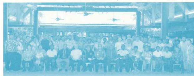
ホニアラ市 環境学習都市宣言