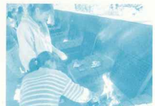
神戸女学院大学 地域活性化論 学外実習