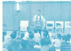
「西宮お酒とびんのものがたり」

*新日本流通(株)、辰馬本家酒造(株)、日本山村硝子(株) (株)山一商会、(株)山村製壺所、(株)吉田製作所