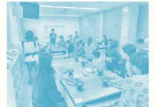
貝類館でのイベント (講師：兵庫県漁業協同組合連合会)