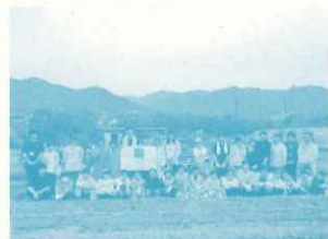
グッドホールディングス株式会社 「こども農業塾」