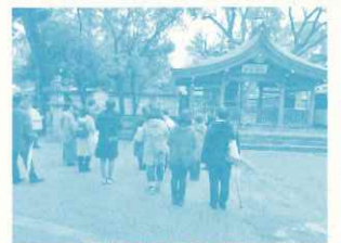
尼崎信用金庫主催 防災セミナー