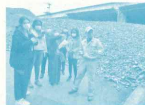
廃棄物管理能力向上 Bコース