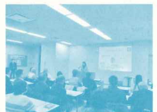
エココミュニティ会議交流会

新型コロナウイルス感染症拡大防止のためワークショップ形式の交流会を中止し、講演会修了後にLEAFのコーディネートにより講演内容を踏まえた意見交換会を行いました。