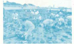
3年生の環境体験： 甲子園浜で生きもの発見

活動場所：甲子園浜 24件、御前浜 3件、潮芦屋 1件、夙川 5件、名塩川 1件、 甲山 3件、甲山と仁川 3件、田んぼ 1件、大池 1件、新池 1件、有馬川 1件、武庫川 1件