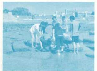
阪急電鉄（株）阪神電鉄（株） 新人研修