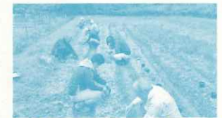
神呪寺農地プロジェクト活動