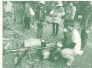
環境保育実地研修(11/10)薪割り体験