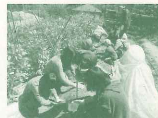
神戸女学院大学農業研究会 サトイモ植付け