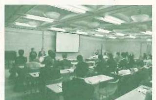
話題提供とワークショップ、パネルディスカッション

大阪ガス(株)エネルギー・文化研究所(CEL)との共同研究として次代を担う人材育成のあり方を農体験等の活動を通じて実証的に研究してきました。2017年度は、日本社会にとっての持続可能な開発目標(SDGs)とはどのようなものか、関西SDGsプラットフォーム・コラボイベントとして、「総合的な人間力、基礎となる生活力育む」という視点を持ち検討することを目的に「次代を担う人材の育成を考えるセミナー」を実施しました。