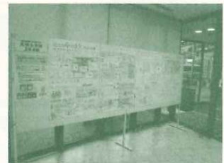
JR西宮駅前の商業施設フレンテ西宮の入口に展示したエコメッセンジャー作品