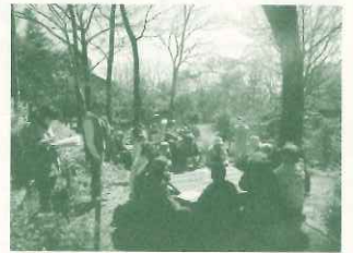
にしのみや都市型里山ボランティア交流会