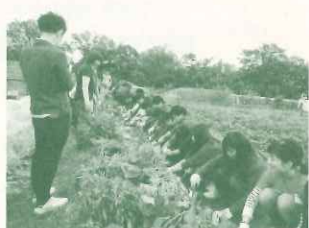
ハウス食品グループ本社（株）内定者研修