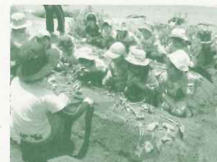
保育所：土にふれ、苗植えを通して自然と生きものつながりを学ぶ