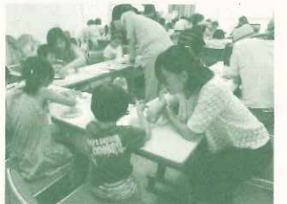
貝類館でのイベント