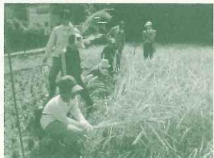
極東開発（株）稲刈りと森林整備体験