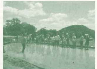
ハウス「食と農と環境の体験教室 in 西宮」