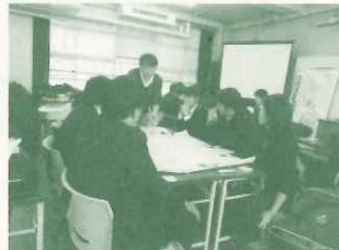
西宮市教職員初任者研修（11/21）