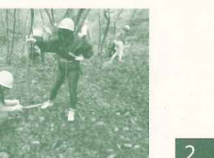
神戸女学院大学 地域活性化論 学外実習