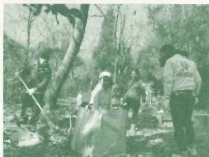
・フコク生命（12/9）「森の中で落ち葉集め やきいも作りにチャレンジ！」（23組 72名）

家庭で子育てを行っている未就園児家庭への支援策として、コープの森・社家郷山をフィールドに落ち葉かきを行ったり、やきいも作りやピザ作りをしながら保護者間の交流を行う。