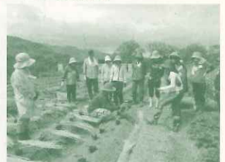
農とくらしをつなぐサポーター養成講座