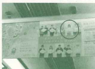
↑阪急電車 車内つりポスター