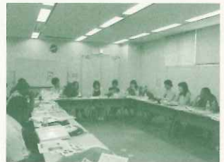
大洋州地域コース