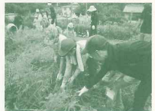
グッドホールディングス株式会社 「こども農業塾」