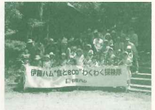
伊藤ハム「食とeco"わくわく探検隊」