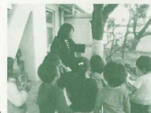
小学校での：校内の樹木につけられたクイズを説明するPTAの保護者