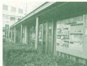
阪神西宮駅近隣にある銀行ウィンドーを活用したストリートギャラリー