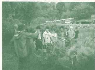
（株）サクラクレパス 新人研修