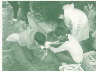
阪急電鉄（株）新人研修