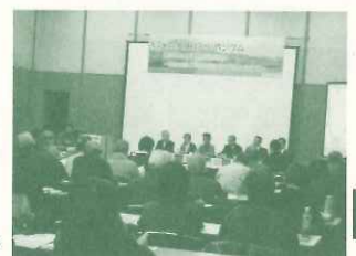
生物多様性シンポジウム