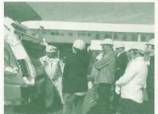
アジア地域コース