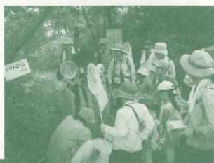
甲山・社家郷山エコひろば 「昆虫ウォッチング」