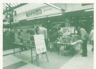
阪急西宮北口駅構内での展示

また、「阪急阪神 ゆめ・まちソーシャルラボ×LEAF」として西宮市協力のもと阪急西宮北口駅構内で西宮市内で見られる魚の水槽展示、LEAFの事業紹介パネル展示を行った他、西宮北口駅周辺を歩き、地域を知り防災を考える「ウォークツアー」(参加者7名)を行いました。(10/28)