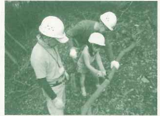
社家郷山で遊ぼう屋 里山くらし体験

生活協同組合コープこうべは兵庫県が2008年度から始めた「企業の森づくり制度」の第1号として西宮市にある社家郷山の整備と現地での環境学習・活動を進めており、LEAFは森林保全、学習事業に協力しています。