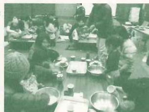
・西宮市子育て総合センター（2018/3/21） 「自然遊びとピザ作りを楽しもう！」（17組 43名）