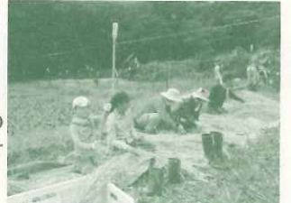
神呪寺農地活動サポーター 稲刈り