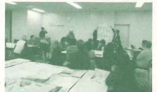
エココミュニティ会議交流会

西宮市内各地域で設置されているエココミュニティ会議において、会議やイベント等の活動サポートを行いました。 34回