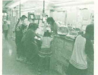
EWC事務局のある環境学習サポートセンター

併設されている「ミニミニ水族館」の見学を楽しんでもらうため、魚に関する「水族館クイズ」や「魚紹介」、ぬりえを毎月作成。延べ約24,523名の利用がありました。