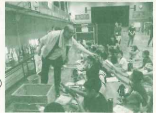
「西宮お酒とびんのものがたり」