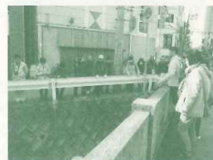
尼崎信用金庫主催防災セミナー