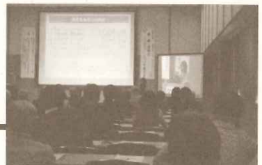
環境まちづくりフォーラム

EWC環境パネル展の開催に合わせ、エココミュニティ会議の交流会が行われ、LEAFのコーディネートによりエココミュニティ会議の活動紹介も含めた意見交換を行いました。