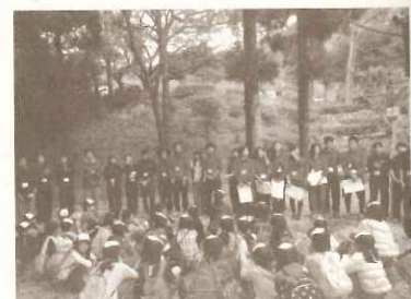
大学生が企画する「甲山309キャンプ」