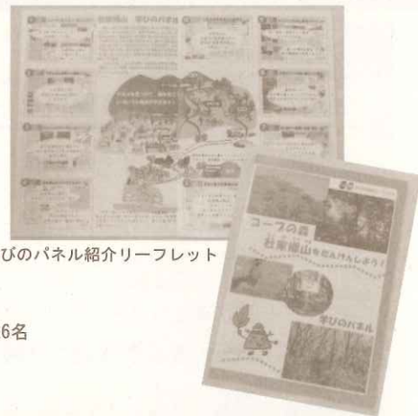
学びのパネル紹介リーフレット