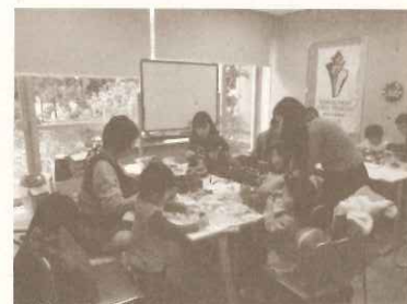
貝類館イベント 貝を使ったクリスマスリースづくり

併設されている「ミニミニ水族館」の見学を楽しんでもらうため、魚に関する「水族館クイズ」や「魚紹介」、ぬりえを毎月作成。延べ約22,062名の利用がありました。