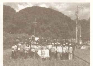
社員が参画する「こども農業塾」