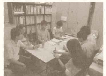
大阪大学 超域イノベーションプログラム