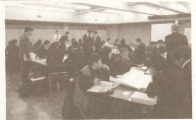
環境教育・ESDカリキュラムデザイン研修