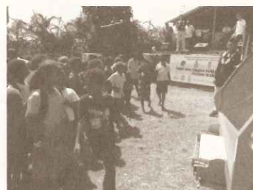
ソロモン：アースデイイベント

バルパライソ州にて行われた第三国研修において、「環境教育を通じた地域環境マネージメント能力」が向上するための研修を実施しました。