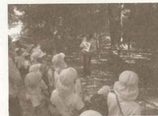
幼稚園：地域の森で行った「生瀬の森たんけん」