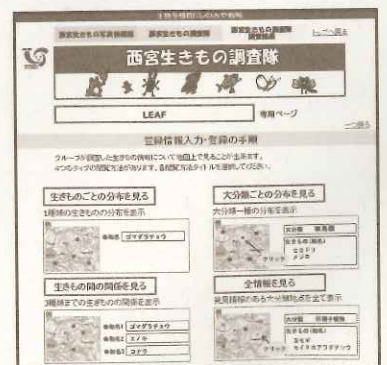
「西宮生きもの調査隊」閲覧画面