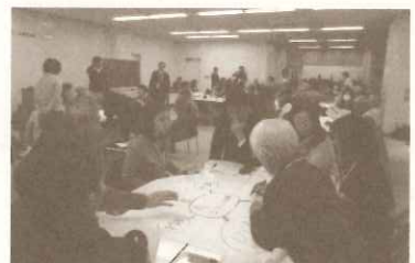
エココミュニティ会議交流会でのワークショップ

西宮市内各地域で設置されるエココミュニティ会議における活動、また会議の設置に向けてのコーディネートを行いました。 42回