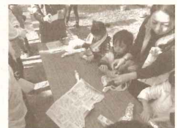
森の子育て：新聞紙でくるんでカマドで焼く、やきいも作り