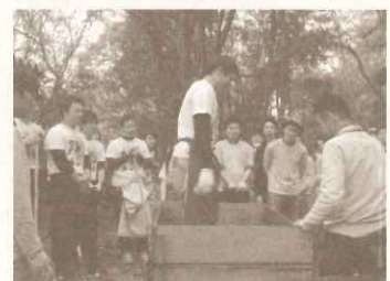
ハウス食品グループ本社(株) 内定者研修