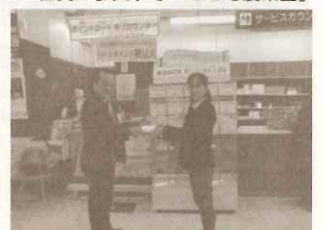
ハートポイント寄贈を受けました