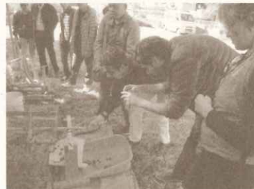
アジアコース：農地での活動を見学

公益財団法人太平洋人材交流センター（PREX）が実施する研修にあたり、日本のくらしと環境について講義しました。