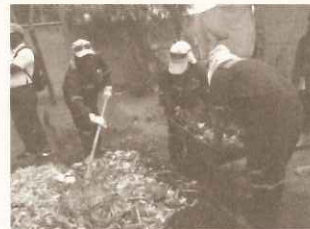
チリ：環境教育センターボスケサンチャゴを視察

アジア各国の廃棄物関係の自治体職員の廃棄物管理や3R推進など環境啓発に向けた行政能力向上を目的に実施し、西宮市での廃棄物の取り組みや市内廃棄物関連事業所、広島県宮島等を見学し、循環型社会の形成に向けて、広域・域内で必要とされる施策に関するアクションプランを作成しました。