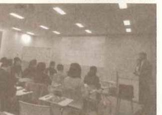
人材育成研修事例発表会