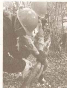
都市型里山ボランティア活動 常緑樹の伐採作業

湿原周辺の常緑樹伐採、モリアオガエル池の清掃、落ち葉かきなど森林・湿原の保全を行いました。 21回 参加者：延べ347名