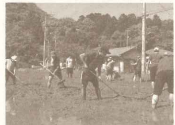
阪急電鉄(株) 新人研修