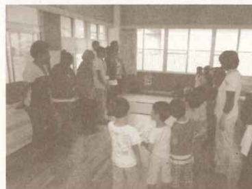
大洋州地域コース：保育所での取り組みを見学

大洋州地域の共通課題である廃棄物問題を長期的な視点から解決に導くため、各国の廃棄物関係の政府及び自治体職員の行政能力向上を目的に実施しました。