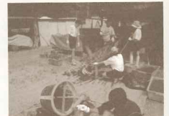
トライやるウィーク受け入れ たい肥作り