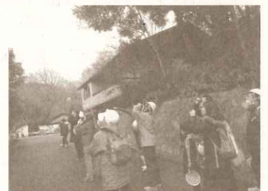
甲山・社家郷山エコひろば 社家郷山の生きもの探検隊 ~鳥のプチ博士になろう~