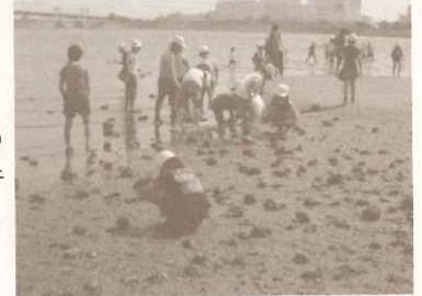
3年生の環境体験：御前浜で生きもの発見