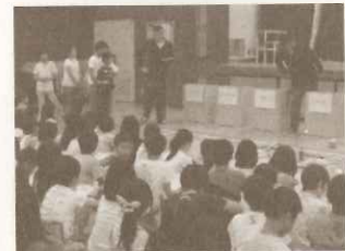
小学校：(株)リリーフ、甲東エココミュニティ会議の協力を受け行った「ごみ」の環境学習授業

開催日：2016/2/24～28 場所：西宮市民ギャラリー 出展数：国内 349点 海外 900点 来場者数：約1,200名