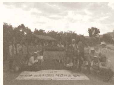
韓国：自然の友研究所からの訪問

出展国 フィリピン共和国、ラトビア共和国、ソロモン諸島 パキスタン・イスラム共和国