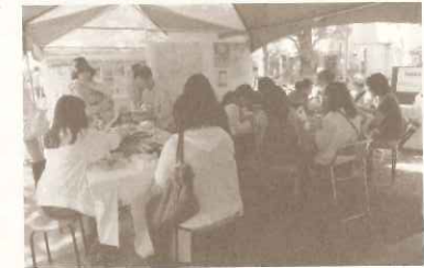
フラワーフェスティバルでのクラフト教室