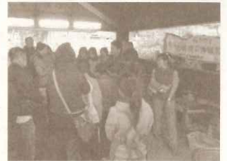
ハウス「食と農と環境の体験教室」タコを捌く