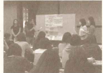
西宮市保育所職員専門研修