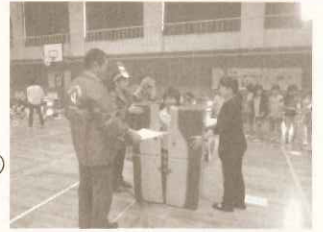
「西宮お酒とびんのものがたり」