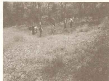
モニタリングは第1・3・4湿原、湿原観察園、仁川広河原、甲山南登山道、山頂、神呪寺農地の8カ所

神呪寺の協力を得て、甲山農業塾を修了したLEAF会員がメインとなり、田んぼ・畑の作業、子ども達の体験活動をサポートしています。甲山周辺の自然環境を豊かにする西宮市の生物多様性保全活動の一環ともなっています。 ・甲陽園小学校5年生、甲陽園エココミュニティ会議が活動 ・神呪寺農地活動サポーター：13組38名 定例活動：50回