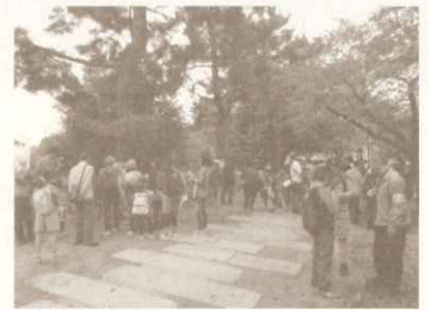
ふるさとウォーク2015の様子は「ベイコム」によりテレビ放映されました