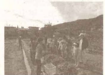
神戸女学院大学 麓林寺農地でのイベント