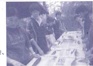
火を起こし、魚をさばき、昼食を作る

研究会メンバー：近畿農政局兵庫農政事務所、兵庫県農政環境部、兵庫県漁業協同組合連合会、兵庫県森林組合連合会、JA兵庫六甲、生活協同組合コープこうべ、大阪ガス(株)エネルギー・文化研究所(CEL)、LEAF