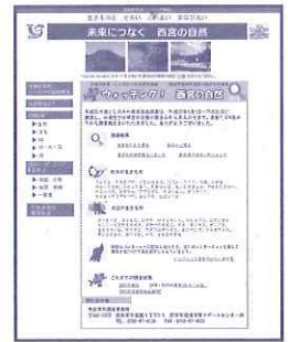
ホームページ「ウォッチング！西宮の自然」