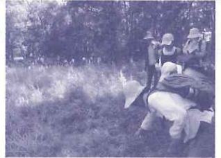
モニタリングサイトを調査

全国1000箇所程度のモニタリングサイトを設置し長期的に生態系、生物多様性の保全施策につなげることを目的とした環境省の事業。(平成25～29年度まで)平成25年度は植物(月2回 延べ286名)、哺乳類の調査(モニターカメラ設置)とホタルの調査(7回 延べ42名)を実施しました。