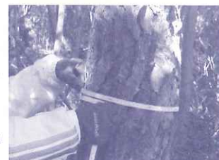
エリアを区切り、樹木の生育年数や数を調査する

湿原周辺の常緑樹伐採、モリアオガエル池の清掃、落ち葉かきなど森林・湿原の保全を行いました。参加者：延べ490名