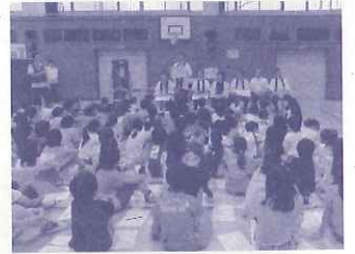
「西宮お酒とびんのものがたり」