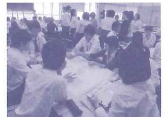
教職員初任者研修： 地域を歩き、学んだ後グループに分かれ、カリキュラムを考えました