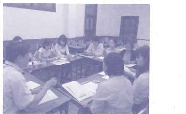
神戸女学院大学大学院インターンシップ第4期研修生オリエンテーション