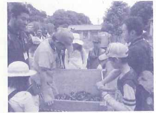
(株)リリーフの社員が参画する「こども農業塾」