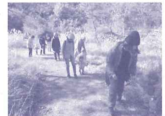
未就園児親子のための森の子育て支援事業： 社家郷山をゆっくり散歩