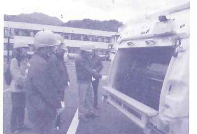
アジアコース：新明和工業(株)でゴミ収集車の製造を見学