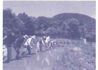
神呪寺農地での田植え

神呪寺の協力を得て、甲山農業塾を修了したLEAF会員がメインとなり、田んぼ・畑の作業、子ども達の体験活動をサポートしています。甲山周辺の自然環境を豊かにする西宮市の生物多様性保全活動の一環ともなっています。 ・甲陽園小学校5年生、甲陽園エココミュニティ会議が活動 ・神呪寺農地活動サポーター: 15組60名 定例活動: 48回