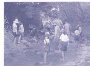
育成センター：「仁川いきものみつけ」