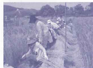
鷲林寺農地：先生のための農体験教室