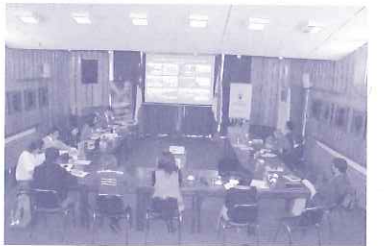
チリ、バルディビア市での話し合い