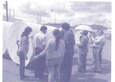
中南米コース：西日本衛材(株)の取り組みを見学