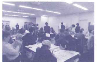
交流会でのワークショップ

西宮市内各地域で設置されるエココミュニティ会議における活動、また会議の設置に向けてのコーディネートを行いました。 52回