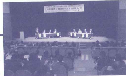
開催日：2014年3月20日 18:30～21:15 場所：西宮市プレラホール 参加者数：234名

シンポジウムのゲストとして、米国バーモント州バーリントン市長のミロ・ワインバーガー氏、10年前に環境学習都市宣言に立ち会われた炭谷茂氏（恩賜財団済生会理事長、元環境事務次官、環境福祉学会副会長）をお迎えしました。