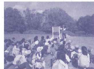
3年生の環境体験：甲山の地形や自然を学ぶ