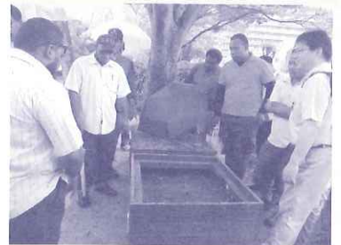
大洋州コース：地域の公園で行われているコンポストの取り組みを見学

出展国：ベラルーシ共和国、フィリピン共和国、インドネシア共和国、ケニア共和国、パキスタン・イスラム共和国、ラトビア共和国