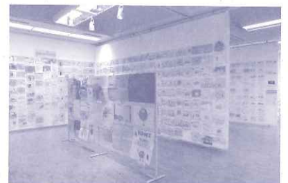
環境パネル展に出展された海外の作品