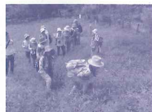
甲山エコひろば 湿原観察