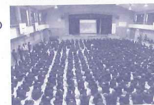
浜脇中学校1～3年生「防災学習」(12/4)