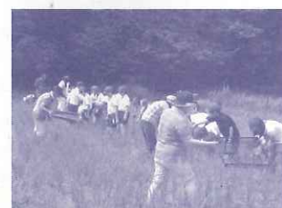
神呪寺農地：草抜きと生きもの観察