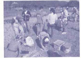
ハウス「食と農と環境の体験教室」稲刈り