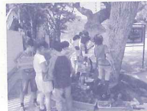
環境学習活動支援 小学校： 学校の樹木を調べる