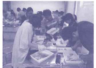
西宮市貝類館イベント: 「イカをまるごと解剖しちゃおう!!」

併設されている「ミニミニ水族館」の見学を楽しんでもらうため、魚に関する「水族館クイズ」や「魚紹介」、ぬりえを毎月作成。延べ約22,584名の利用がありました。