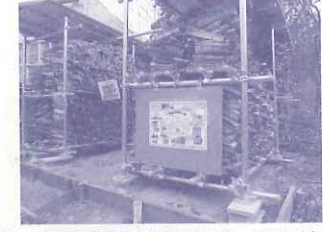
ライフ&ネピア：薪保管棚と「循環の森」解説看板