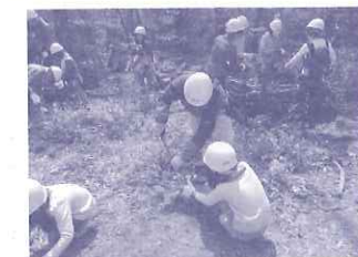
杜家郷山：子どもたちの間伐体験