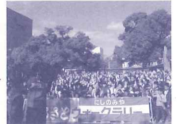
ふるさとウォーク2013の様子は「ベイコム」によりテレビ放映されました