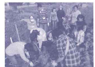
神戸女学院大学： 地域活性化総合実習のイベント