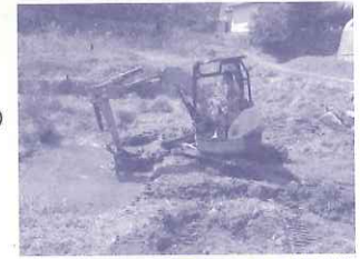
イオン環境財団：ため池整備