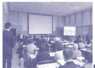
環境まちづくりフォーラム

■エココミュニティ会議交流会 開催日: 2014/3/1 場所: 西宮市民ギャラリー 参加者: 63名 EWC環境パネル展の開催に合わせ、エココミュニティ会議の交流会が行われ、LEAFのコーディネートによりエココミュニティ会議の活動紹介も含めた意見交換を行いました。