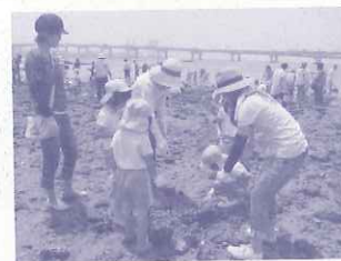
環境学習活動支援 幼稚園： 甲子園浜で生きものウォッチング

開催日：2014/2/26～3/2 場所：西宮市民ギャラリー 出展数：国内 406点 海外 921点 来場者数：約1400名