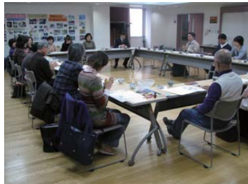
地域の諸団体が交流し課題を共有