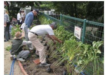
まちづくりの活動を活発にします