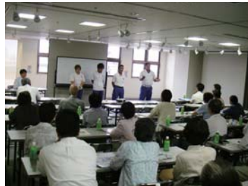
地域の課題について勉強会