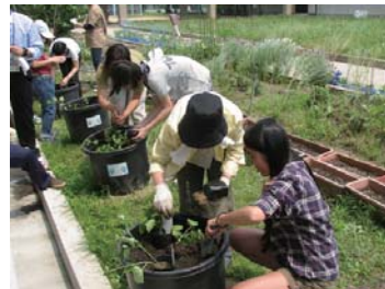
地域と学校が協力した活動