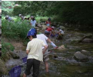
地域と子どもたちをつなぐ活動を推進します